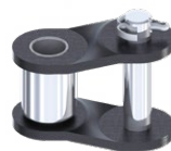
Falsa maglia semplice a copiglia RIF : 016