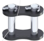
Maglia di giunzione a copiglia RIF : 008