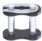
Maglia di giunzione a molletta RIF : 006